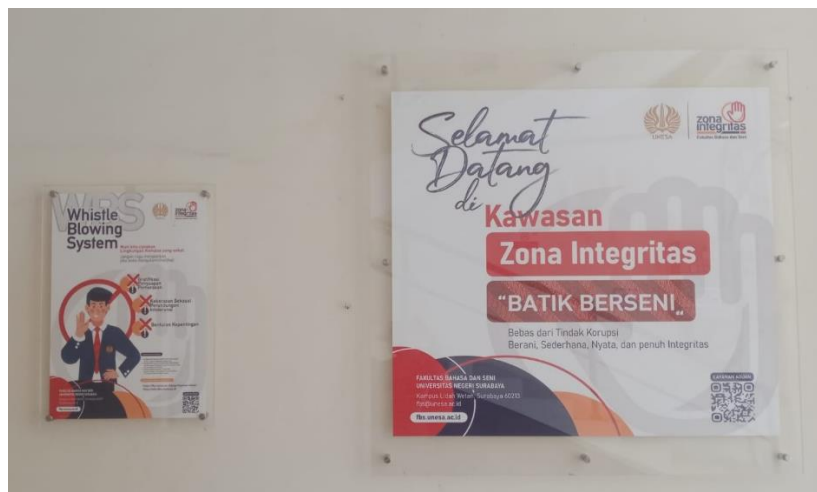
Gambar 2. Poster terkait Zona Integritas FBS UNESA

QR code tersebut juga dapat ditemui di beberapa poster yang telah dipajang di lingkungan FBS terkait pelaksanaan Zona Integritas di FBS.