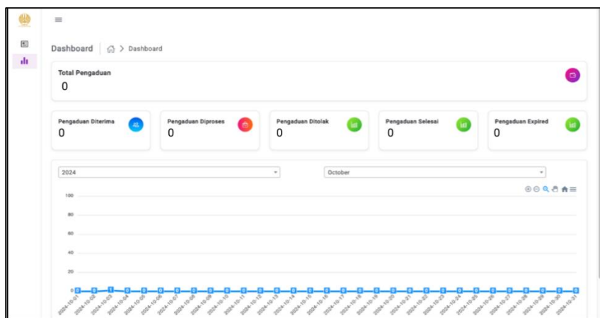
Gambar 4. Data pengaduan di WBS ZI FBS

Dalam Laporan pelaksanaan periode ini, berikut adalah rekap aduan yang masuk dari tanggal 1 November hingga 31 November 2024 melalui laman WBS ZI FBS Unesa.